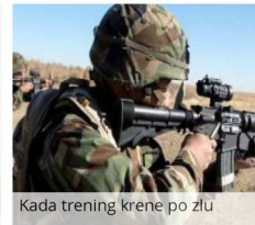
Kada trening krene po zlu