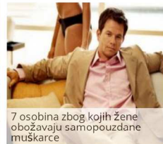
7 osobina zbog kojih žene obožavaju samopouzdanu muškarce