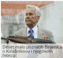
Deset malo poznatih činjenica o Kalašnikovu i njegovom tvorcu